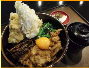
スタミナ海堡井 1,300円

富津の穴子を使用した和と韓のハーモニーを混ぜて美味しいスタミナ丼！若者から年配の方まで食べやすい味に仕上げました。