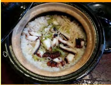
地ダコ釜飯一合炊き 1,296円

魚沼産コシヒカリを鰹昆布出汁と薄口醤油で炊き上げます。地ダコの柔らかさと出汁の香りをご堪能下さい。