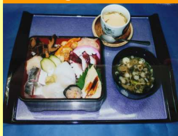
9種ネタの海堡井 1,620円

富津岬周りで獲れた新鮮魚介類を5種類以上(海苔、いちご貝、ニシ貝、穴子、地ダコ等)使用したボリューム満点の海鮮丼です。