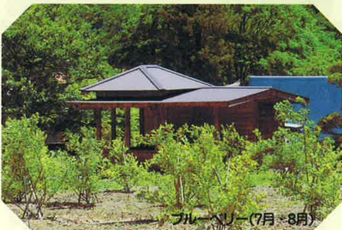
ブルーベリー(7月・8月)