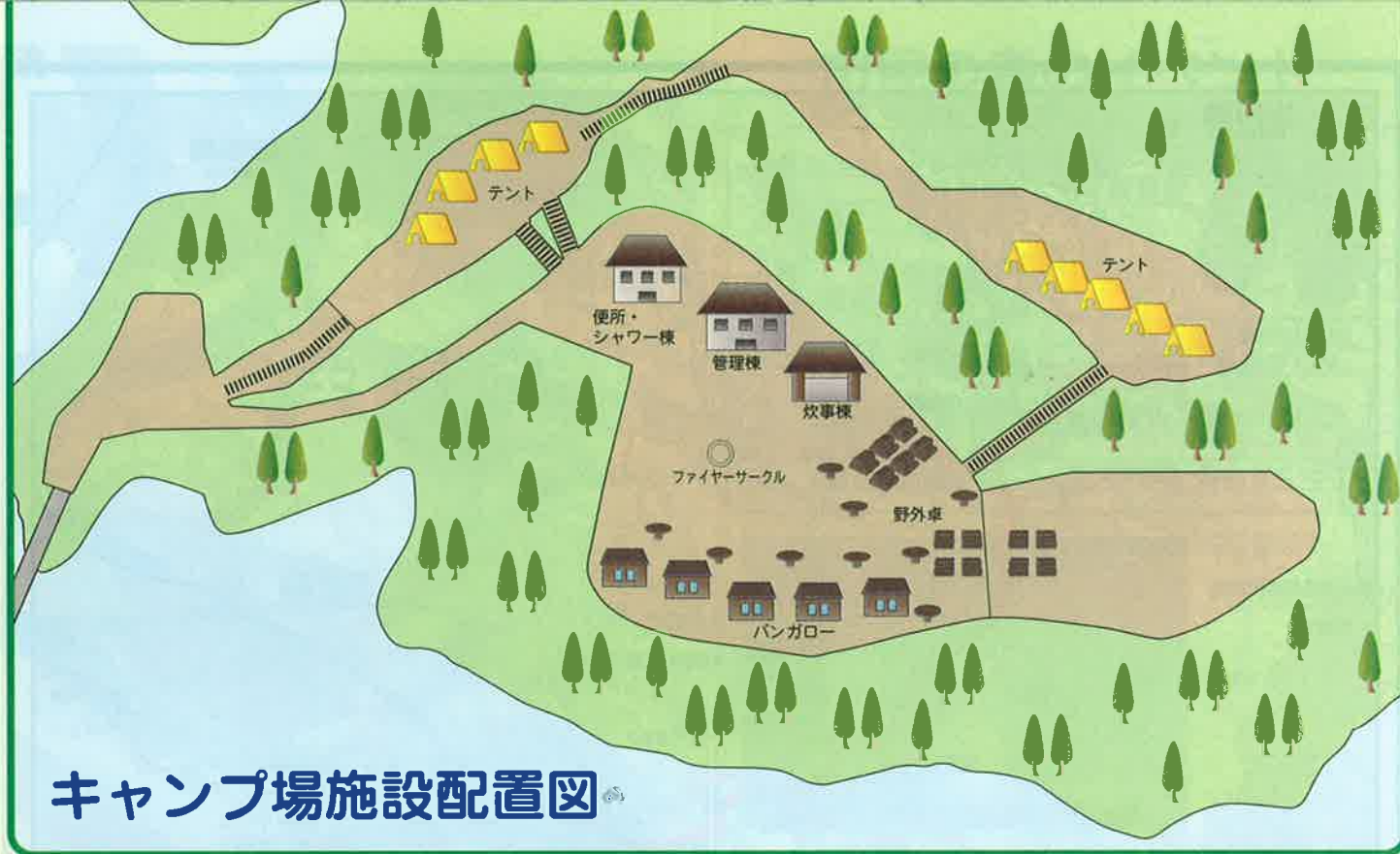
キャンプ場施設配置図