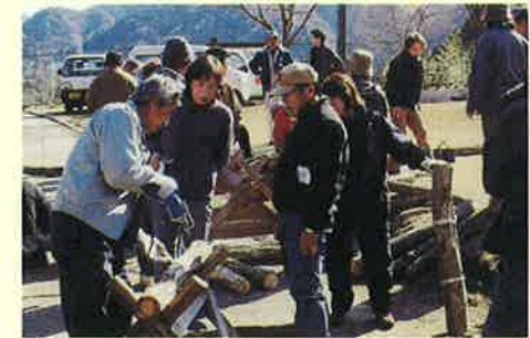
2月 シイタケ作り教室