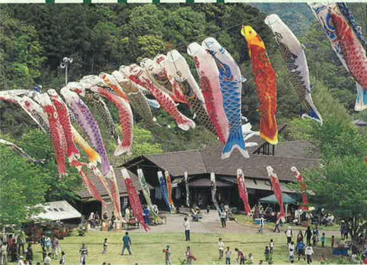
市民の森フェスタ(5月5日)

市民の森は、房総半島中央の豊かな自然の中に位置しています。山や谷を取り込んだ約50ヘクタールもの広大な敷地に、パノラマ広場、ふれあい広場や野鳥の森などの施設が点在しています。夏にはバンガロー、炊事やシャワーなどの施設の完備されたキャンプ場も開設され、南房総の観光拠点としても絶好のロケーションです。また、駐車場、遊歩道も整備されていますので、4km・6kmのハイキングも楽しむことができます。