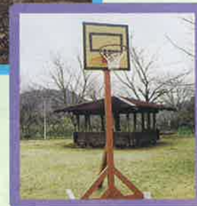
遊具(上:ジャンボスライダー 左下:バドミントン 右下:バスケット)