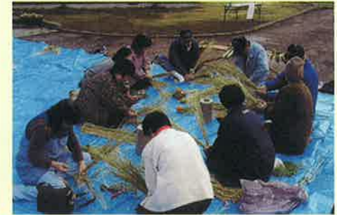
12月 お正月お飾り作り

※ 上記日程は毎年変わりますので、参加の際には 千葉県森林組合富津事務所 0439-67-0729 までお問い合わせください。