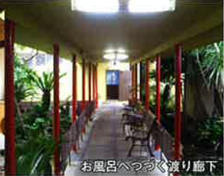
お風呂へつづく渡り廊下