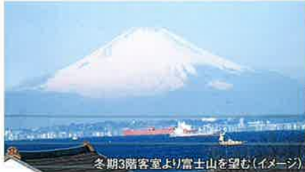
冬期3階客室より富士山を望む(イメージ)